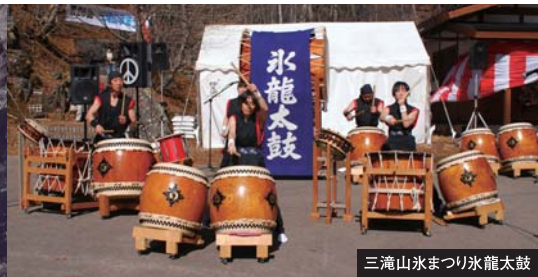
三滝山氷まつり氷龍太鼓