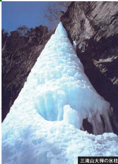
三滝山大禅の氷柱

『中部横断自動車道』は、静岡・山梨・長野の3県を南北に縦断する延長約136kmの高速道路で、上信越自動車道を介して太平洋側と日本海側(上越市)を結ぶことで地域連携を支える最も重要な社会基盤と位置づけられています。