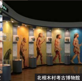
北相木村考古博物館