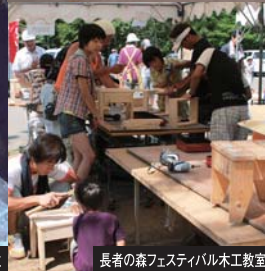
長者の森フェスティバル木工教室