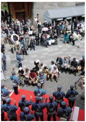
・東嘉会による静岡木遣りの披露