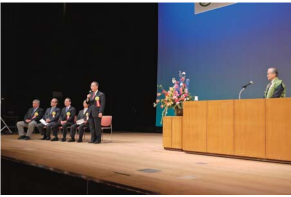
・徳川家臣団子孫の会の各会長から活動内容を紹介

続いて、徳川家臣団の子孫たち で組織されている5団体「柳営 会」「牧之原開拓幕臣子孫の会」 「開陽丸子孫の会」「万延元年遣 米使節子孫の会」「咸臨丸子孫の 会」から参加された80名の子孫の 方々を称えるとともに、各団体の