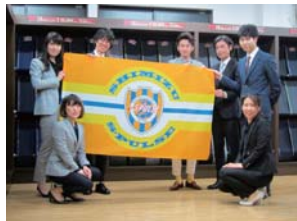
エスパルスを応援する社員の皆様

〈連絡先〉 オーダースーツ アーク中田店 静岡市駿河区中田本町6-1 TEL054-659-5558 http://www.e-sebiro.com/ 静岡市店舗:中田店、鷹匠店、草雑店