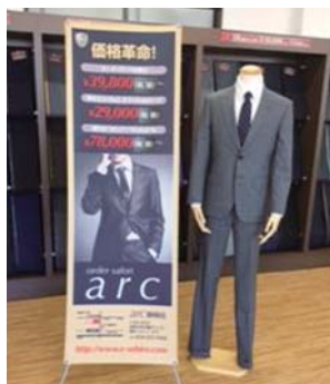
エスパルスオフィシャルスーツ ¥29,000(税別)

今シーズンJ1での厳しい戦いにも勝ち抜いてくれると信じ、従業員一同、心より応援しております! オフィシャルスーツを着て一緒にエスパルスを応援しましょう!