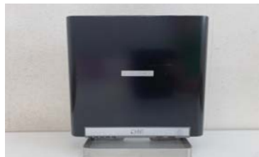
エアフィード (色は3種:黒・白・木目) 196,000円(税別)

気に戻るため、安心・安全です。サラスは小型で充電式なので、車内や部屋干しの臭い等にも効果的! エアフィードは事務所等の広い空間にも対応! レンタルもできます! 会員様限定特別価格を用意しましたので、ぜひご活用ください。