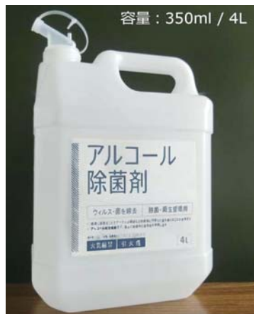
容量: 350ml / 4L

清水区の自社工場にて、徹底した品質管理のもと製造しました高濃度アルコール除菌剤を4Lポリ容器で販売して