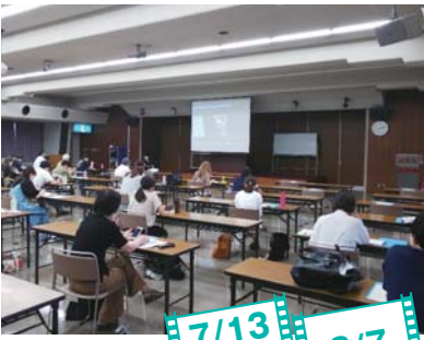
7/27セミナー時の様子