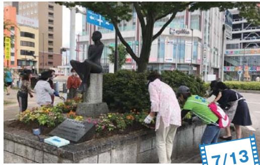
花苗植栽活動に取り組むメンバーら