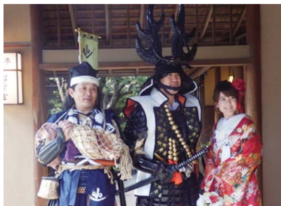
甲冑ウェディングのお客様と共に

「時間が経つのも忘れるほど仕事に夢中になれるなんて素晴らしい」、そんな素敵な職務を全うすることを当たり前に取り組んでいる社員をこれからも大事にし、事業の発展を推し進めていきたいと思っています。