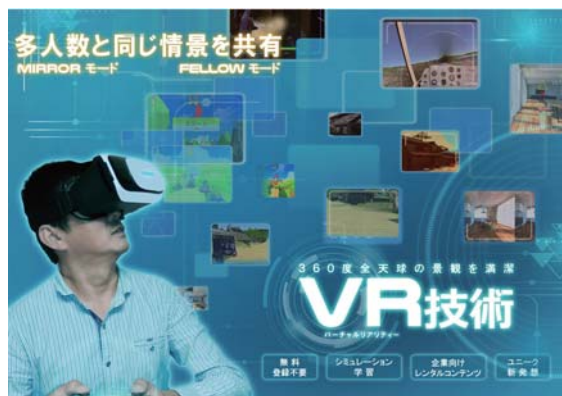
VR・MR技術開発に注力