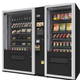
MMV (マルチ・モジュール・ベンダー)

コロナ特別対応型持続化補助金を活用して非対面型ビジネスへの転換を図りませんか? 2 温度帯管理により、おにぎり・お弁当・サンドイッチと飲料・お惣菜等の同時販売が可能な自動販売機「MMV」がお手伝いいたします。また消毒液1ℓで約1,000回使用でき、消毒液の節約にも有効な非接触式手指消毒器「て・きれいさ」もご提案します。