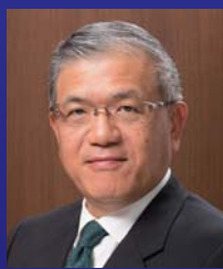
今川義元公生誕五百年祭 推進委員会 副委員長 〔静岡商工会議所会頭〕