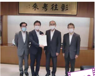
田辺市長（左から2人目）に提言書を手渡す同会の関係者（市本庁舎）