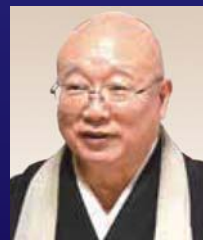
今川氏ゆかりの寺 臨濟寺 住職