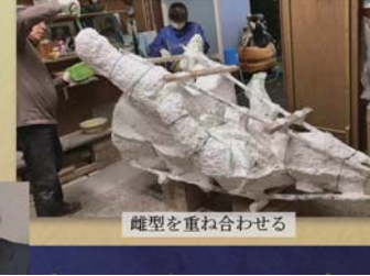
雛型を重ね合わせる