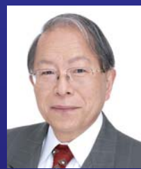
今川義元公生誕五百年祭 推進委員会 委員長 〔静岡大学名誉教授〕