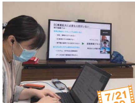
7/21セミナー時の様子