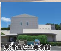
東海道広重美術館