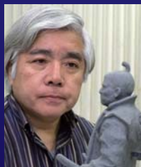
今川義元公像 制作者 彫刻家