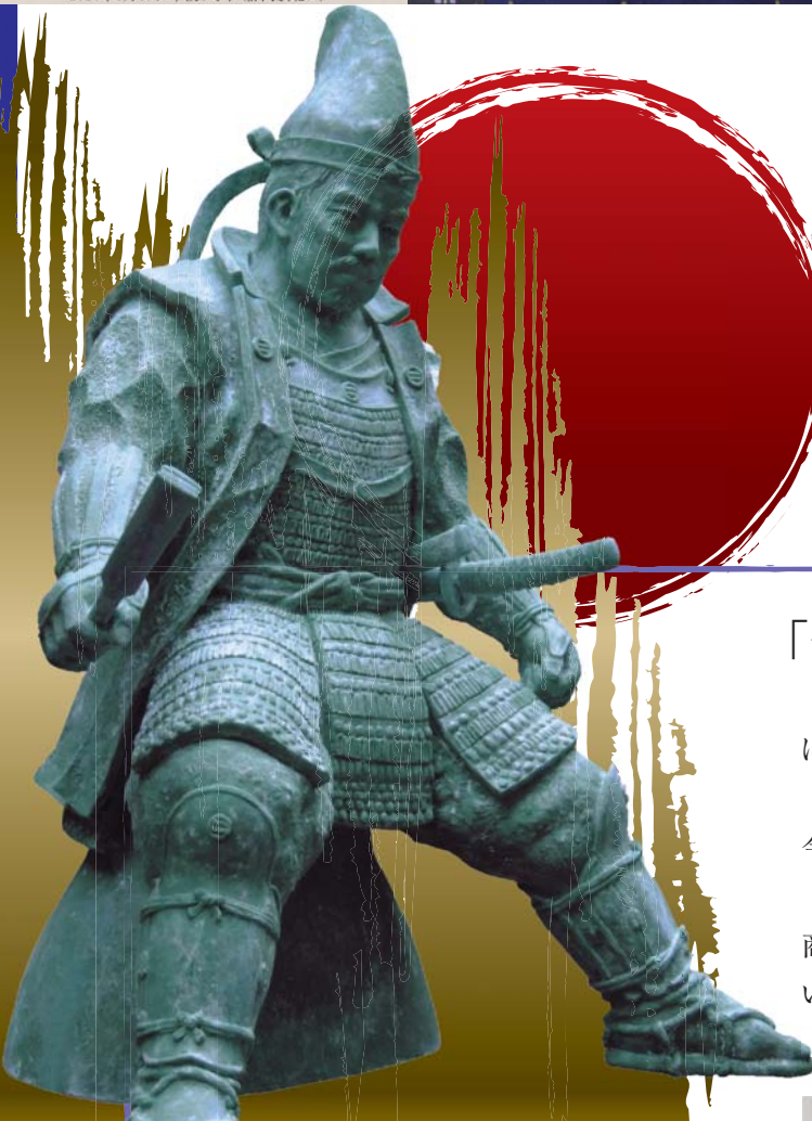
銅像の型を造る樹脂原型